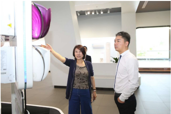
本报讯 9月19日上午，一位集才华和颜值于一身的互联网神秘大咖现身格力电器，他就是京东商城创始人、京东集团CEO刘强东。在一天的紧张行程中，刘强东先后参观了格力智能装备基地、格力电器总部以及银隆新能源汽车公司。刘强东坦言非常欣赏格力公司的“实文化”和格力人的实干精神，并专门嘱咐助理拍下位于格力电器公司销售楼大厅的“空谈误国，实干兴邦”几个大字。

回程路上，刘强东不禁晒出这样一条朋友圈：第一次参观格力集团！董小姐的强大信念、刚毅、智慧以及对品质和核心技术追求的精神，真是令人赞叹！如果中国多一些这样的企业，想不崛起都难啊！